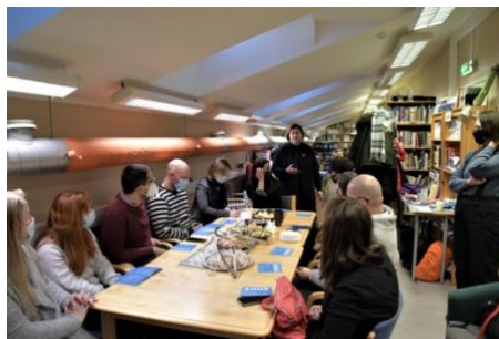
Darbnīca Tallinā, Igaunijā.

2022. gada aprīlī plānoti attālinātie pasākumi Dānijā (Odensē) un Latvijā (Rīgā).