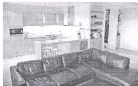
Dzīvoklis, Rīga, Ziepniekkalna, 169 000 €