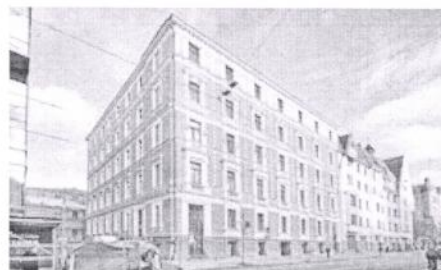
Noslēgumam tuvojas vēsturiskā nama Lāčplēša ielā 13 renovācija

Mežaparku arvien vairāk izvēlas kā vietu, kur investēt naudu.