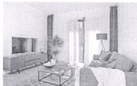
Dzīvoklis, Rīga, Centrs, no 104 000 €

programmas mērķis ir iestāties par ikviena tiesībām dzīvot cilvēka cienīgu dzīvi un pilnībā iekļauties sabiedrībā. EMIN ietvaros tiks vākti paraksti petīcijai par to, lai gan Latvijā, gan Eiropas līmenī tiktu noteikts un nodrošināts adekvāts minimālā ienākuma apmērs ikvienam iedzīvotājam. Papildus tam arī ar citiem pasākumiem mudināsim valsts attīstības redzējumā un Eiropas politikā kā caurviju kritēriju