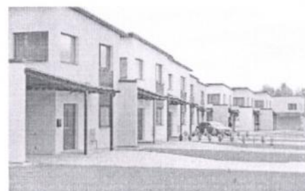
Māja, Salaspils pag., 149 000 €