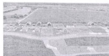
Zeme, Piņķi, 50 900 €