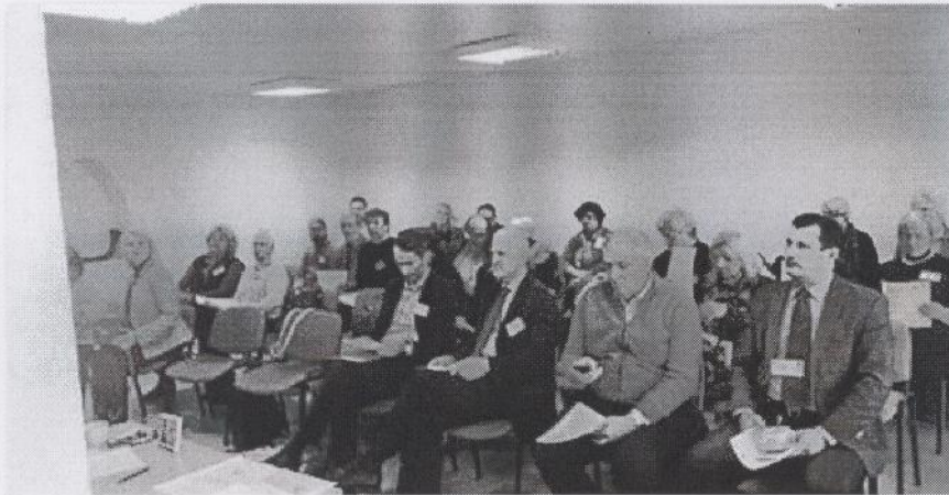
FOTO: "EAPN-Latvia" eksperti sagatavo plānu nabadzīgo un sociāli atstumto iedzīvotāju grupu interešu aizstāvībai 2018.gadam - Protesti.lv